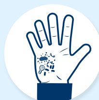
Brak higieny personelu sprzątającego